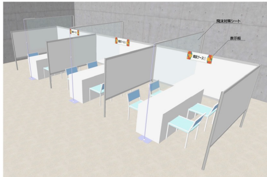
アリーナ内にブースを設置

商談ブースはパネルに仕切られているので周りを気にすることなく落ち着いた環境で商談を実施することが可能です。